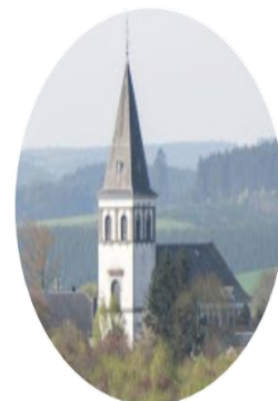
Secteur Pastoral de Vaux-sur-Sûre